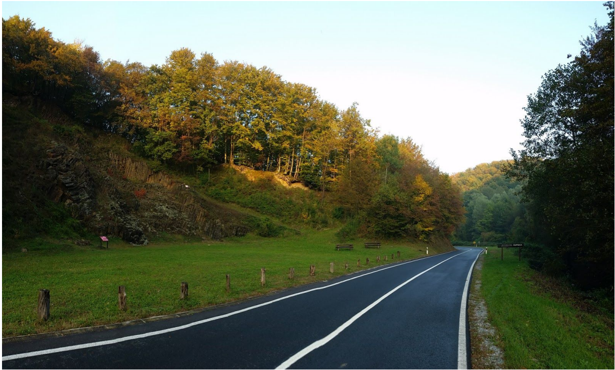
Slika 3. Rupnica