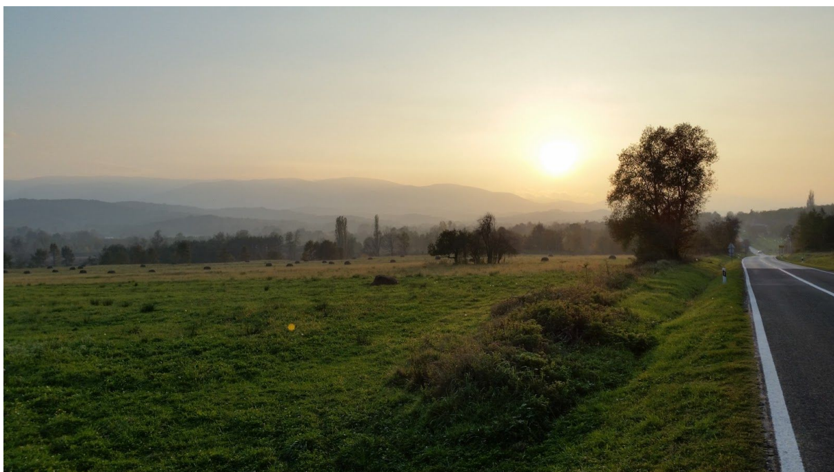
Slika 6. pogled na Papuk