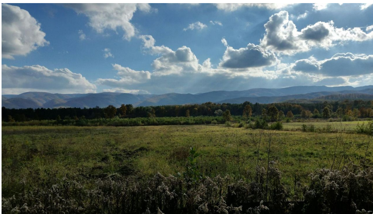
Slika 5. pogled na Papuk