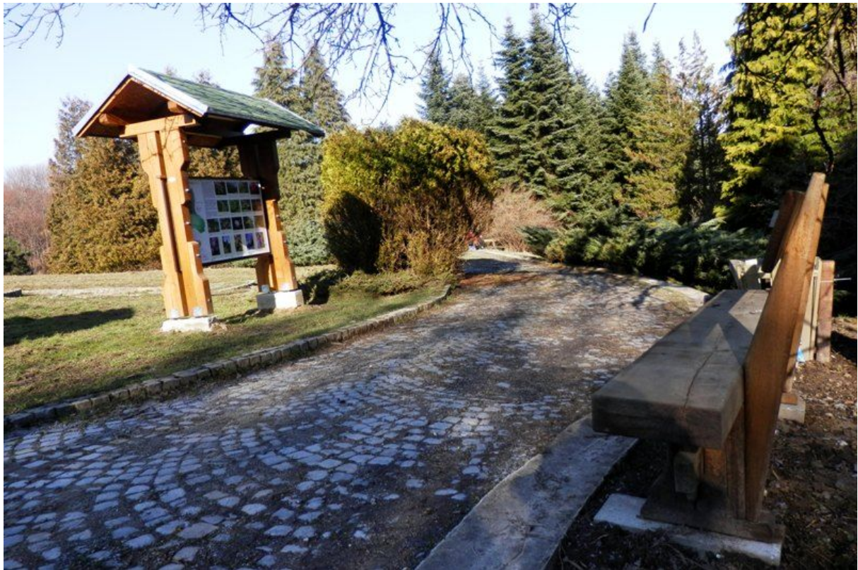
Slika 1. Arboretum Lisičine