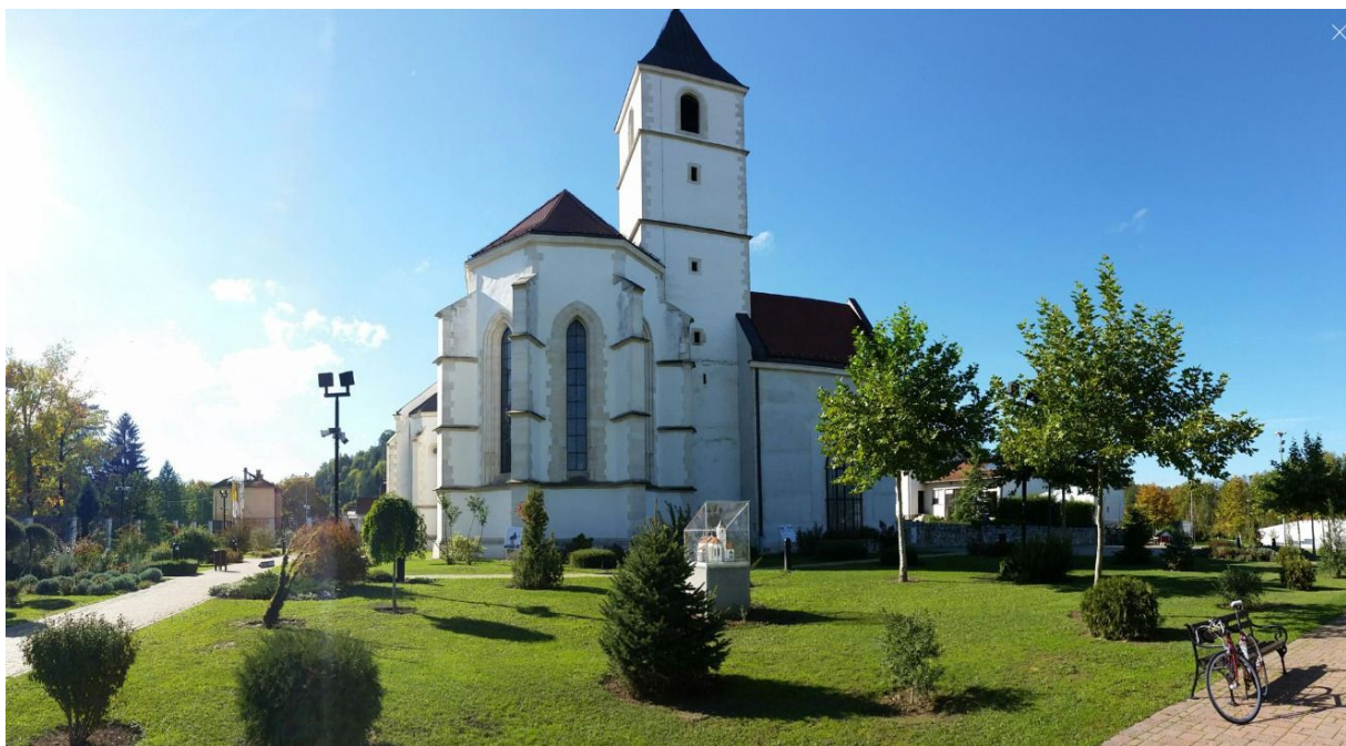
Slika 2. Crkva u Voćinu