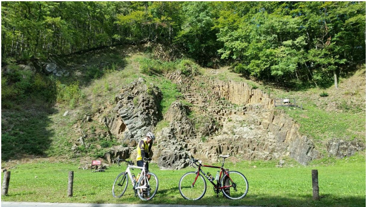
Slika 4. Rupnica