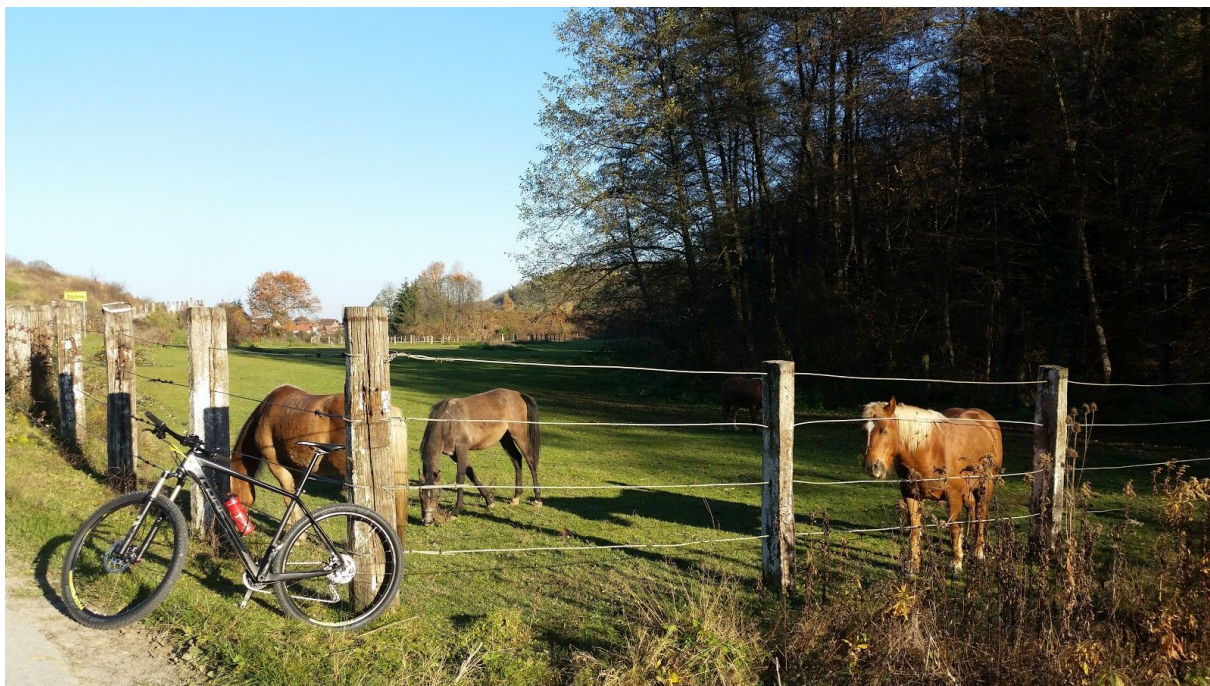
Slika 1. Kod odmarališta Bunarić

Za rutu kao što je ova obiteljska, kritična točka odnosi se na ne postojanje obilježene biciklističke staze na važnoj prometnici.