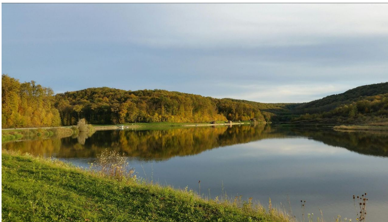
Slika 2. Jezero Javorica