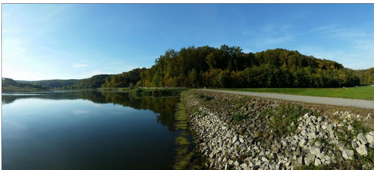
Slika 3. Jezero Javorica